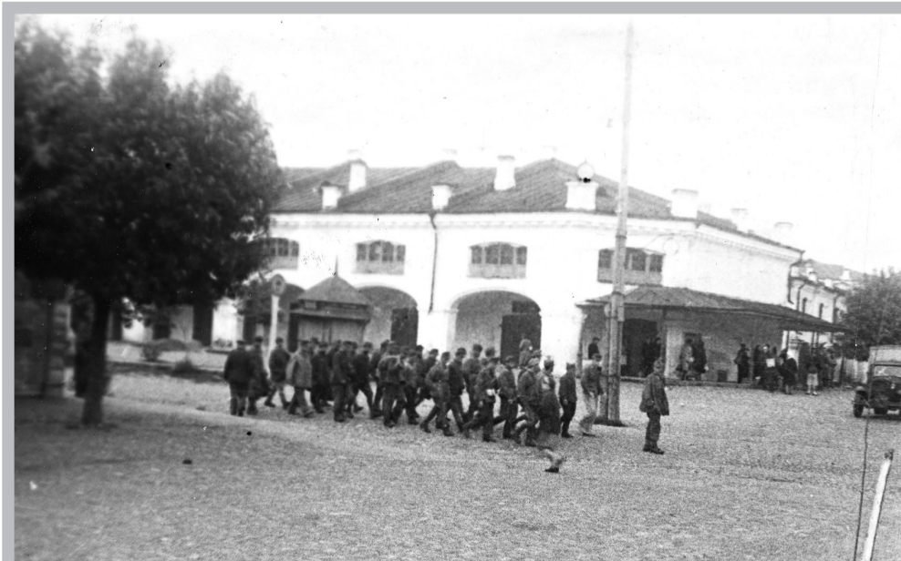
Военнопленные немцы на ул. Коммунарной