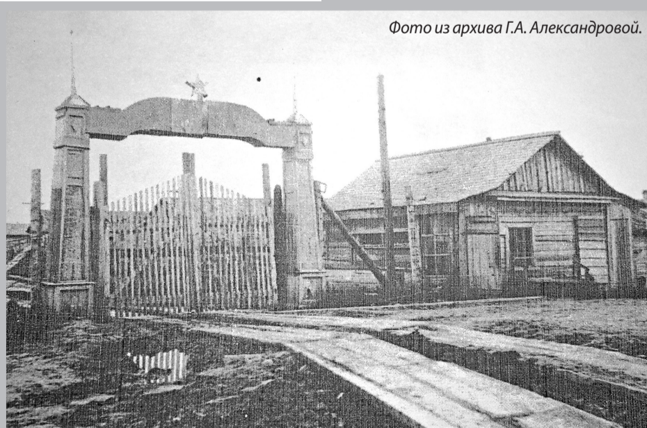
Общий вид лагеря для военнопленных, д. Ёгла